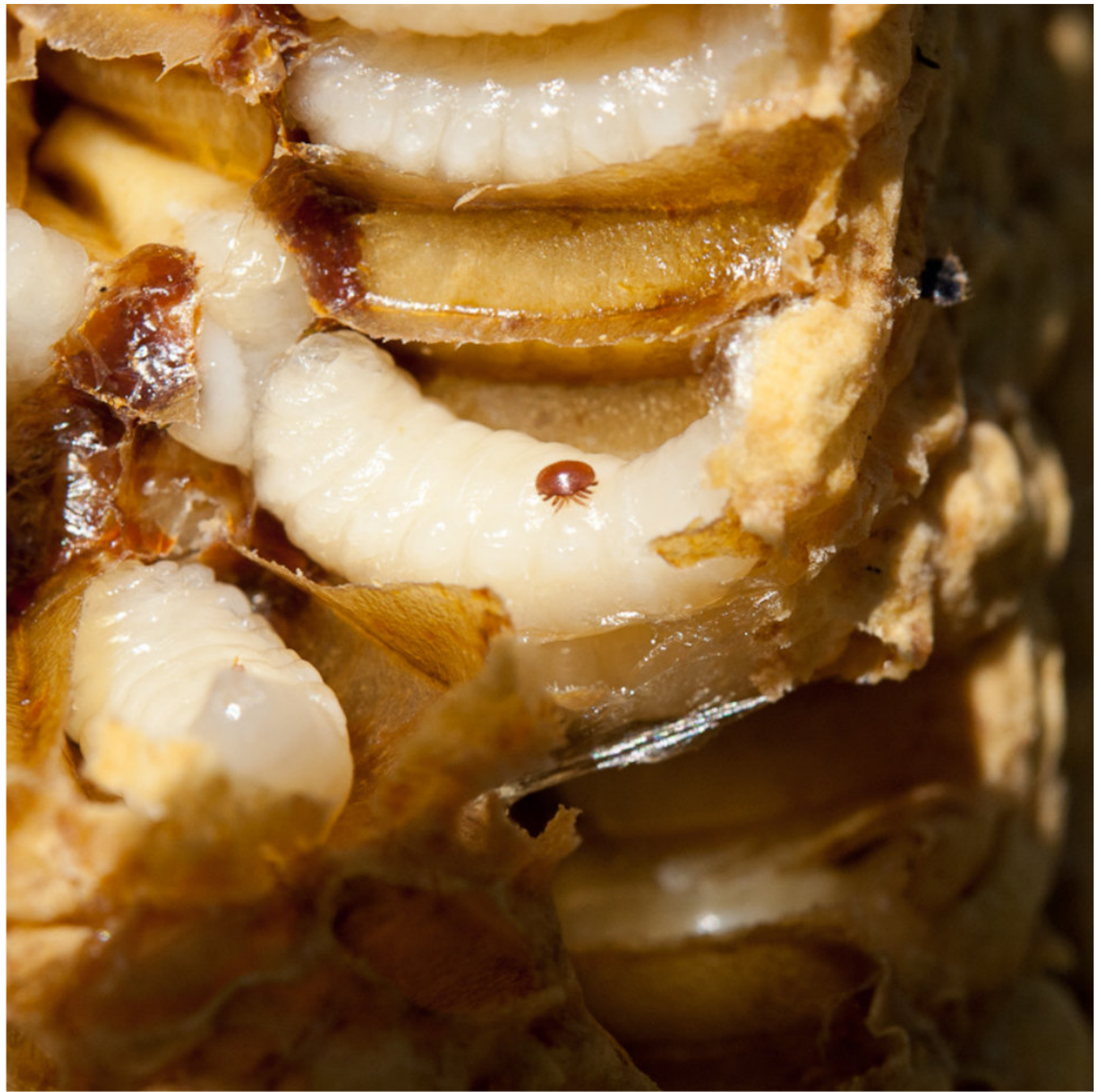
Varroamilbe Mohr & Müller Müncheberg | Brandenburg