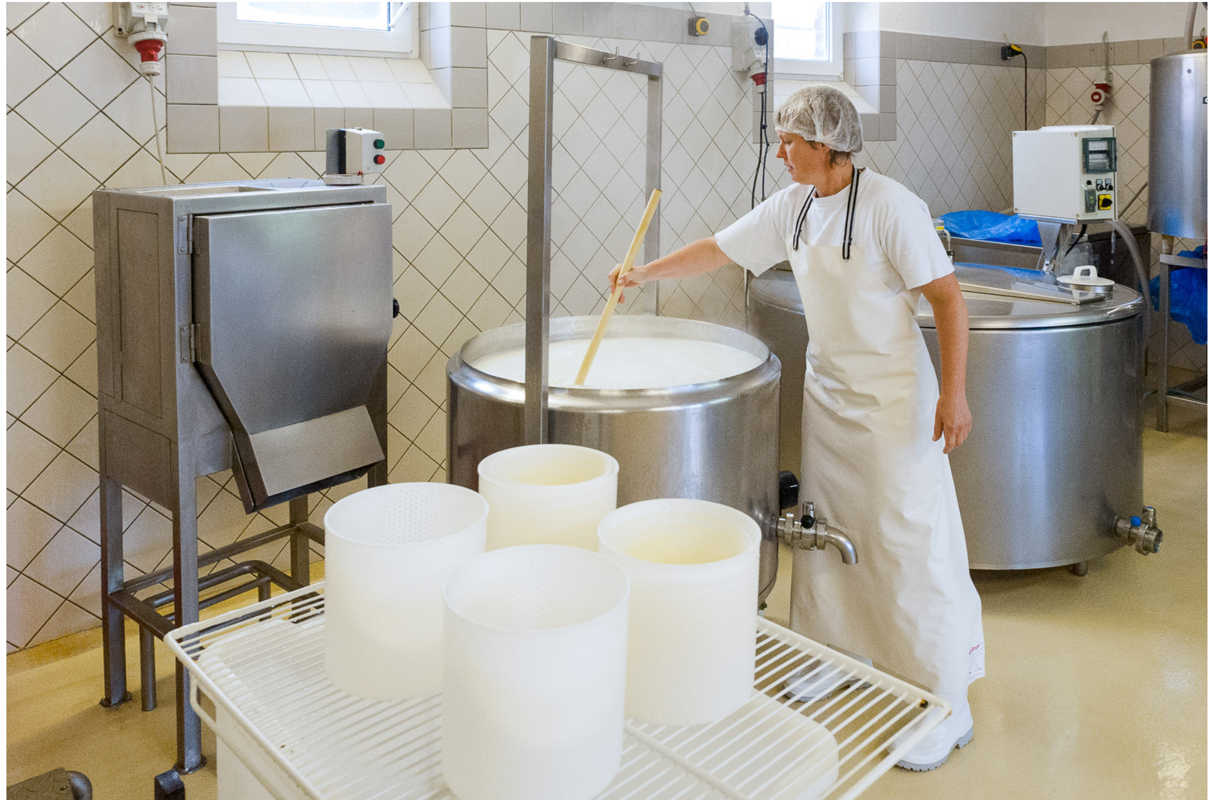
Mozzarella Herstellung Bio-Hof Bobalis Jüterbog | Brandenburg