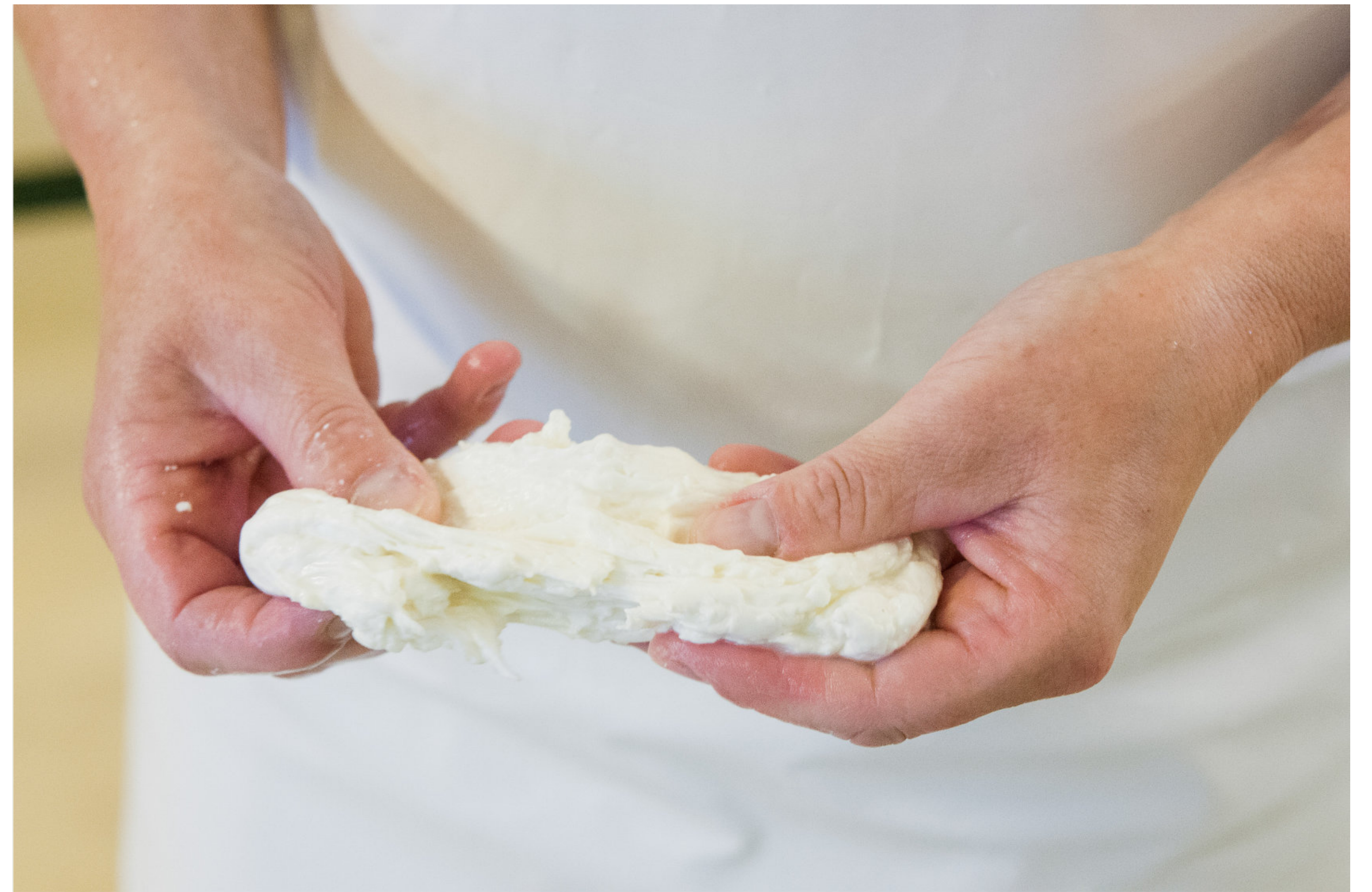
Mozzarella Herstellung Bio-Hof Bobalis Jüterbog | Brandenburg